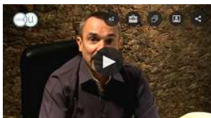
La transformation digitale des entreprises http://bit.ly/2DX9swO