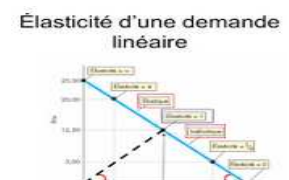
Les élasticités de la http://bit.ly/2nxWfE

Ces ressources numériques sont de simples illustrations des cours que les lycéens seraient amenés à rencontrer.