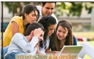
Introduction à la gestion http://bit.ly/2DZm5vy