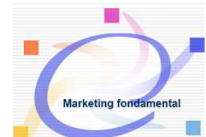
Marketing fondam http://bit.ly/2DWqfAn