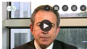
L'information au cœur de l'intelligence économique http://bit.ly/2nvH4LZ