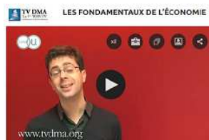
Fondamentaux de l'économie http://bit.ly/2DWqfAn