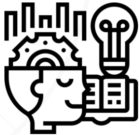
Usages & Outils